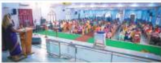
रविवार की सेवाएँ